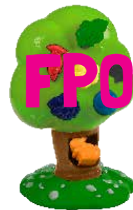
Bright Basics™ Sorting Tree