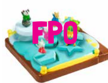
Bright Basics™ Shapes-Sorting Popper