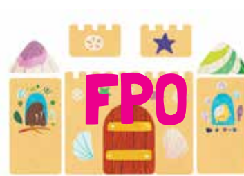
Bright Basics™ Bath Blocks

Developed in Southern California by Educational Insights. © Educational Insights, Gardena, CA (U.S.A.). All rights reserved. Learning Resources Ltd., Bergen Way, King's Lynn, Norfolk, PE30 2JG, UK. Please retain the package for future reference. Made in China. educationalinsights.com