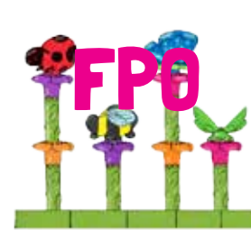
Bright Basics™ Peg Garden