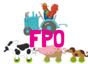
Bright Basics™ Tractor Pull