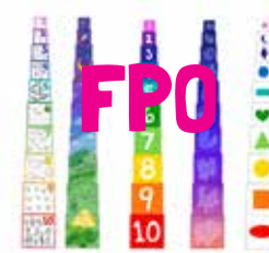
Bright Basics™ Nest & Stack Cubes