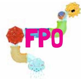
Bright Basics™ Slide & Splash